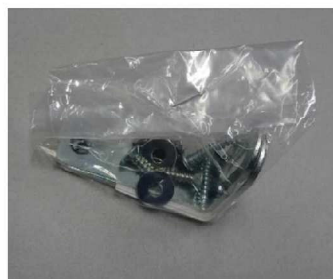
取り扱い説明書入りの部品パック