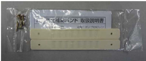
取り扱い説明書入りの部品パック